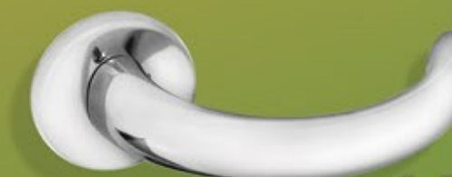
Ilustração com ESPELHO - Illustration with MIRROR - Ilustración con ESPEJO

127 AL/Z Roseta / Rosette / Roseta 227 AL/Z Espelho / Mirror / Espejo CR - CRA - ATQ - EP